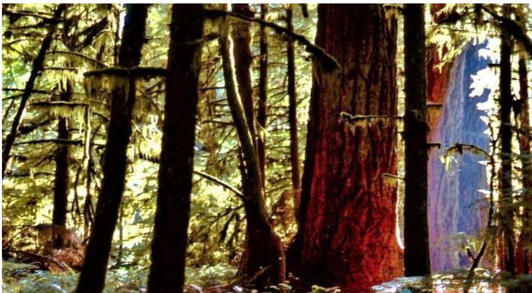
im nordamerikanischen Küsten-Regenwald

Die Historikerin Andrea Wulf macht mit ihrer Biographie über Humboldts Leben und Denken dem Leser bewusst, dass die ökologisch-systemische Erkenntnis über 200jährige Wurzeln hat, dass wir aber noch heute weit davon entfernt sind, die wahrscheinlich einzige Maxime für den Weg aus der Katastrophe zu sehen und danach zu handeln.